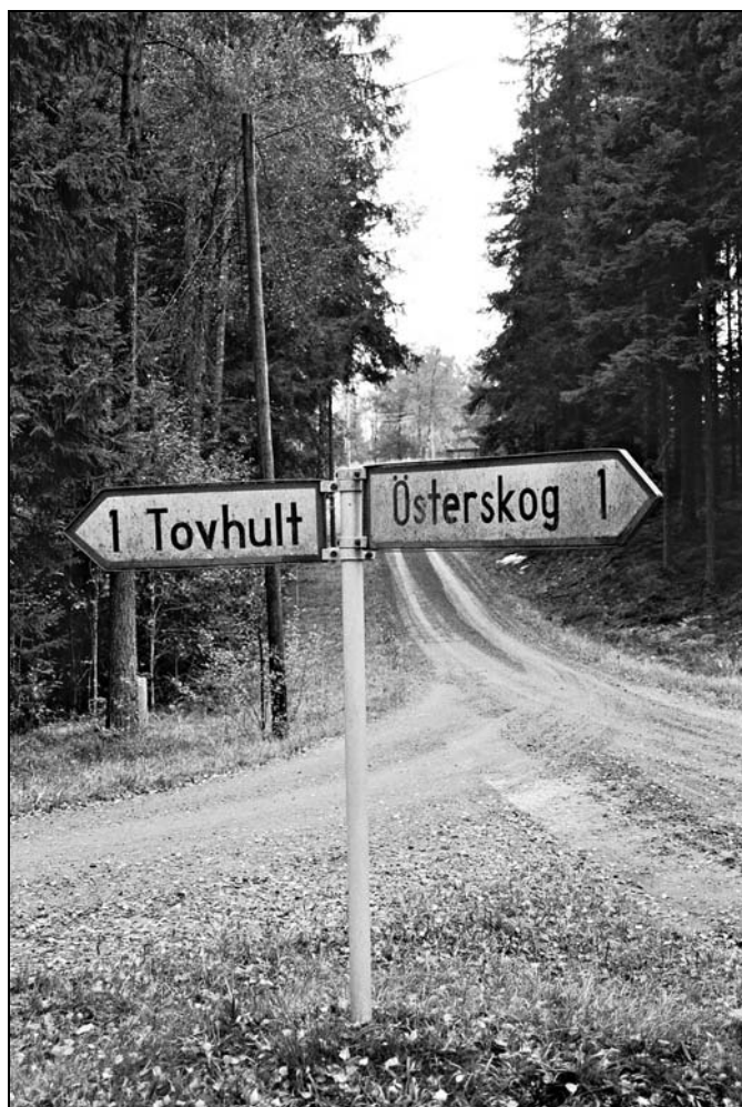
Vägvisare i korsningen vid Annelund, Bredaryd

Till vägmiljöerna hör även vägvisningsskyltar, mötesskyltar m fl. 1734 års gästgiveriförordning beslöt att skyltar skulle sättas upp längs de större vägarna. Äldre vägvisare är skyddade som forn lämningar. Värda att bevara är 1900-talets gula vägvisningspilar i järn, med röd ram och svart text. De kan fortfarande ses vid en del mindre vägsträckningar, t ex i det lilla vägkorset i närheten av Tovhult, Bredaryd, där en pil pekar mot Tovhult och den andra mot Österskog. Vägvisningsskyltar blir allt vanligare och har fått en förändrad utformning i samband med bilismens allt större utbredning och anpassningen till internationella trafiköverenskommelser.