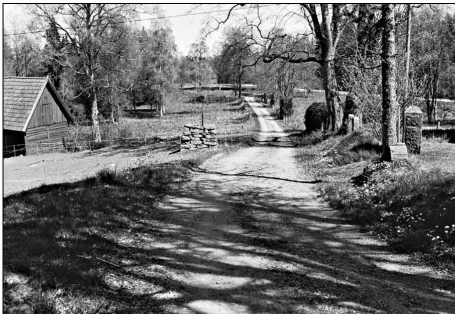
Den gamla byvägen genom Västra Gunnamo, Gällaryd. Till vänster om vägen återfinns milstenen.

En fin placering i ursprungligt läge har milstenen vid den gamla byvägen i Västra Gunnamo, Gällaryd.